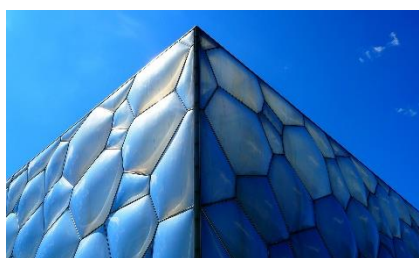
ARQUITECTURA DEL CUBO DE AGUA EN BEIJING

Fue construido para los juegos olímpicos de 2008 y se ha convertido en una de las construcciones más emblemáticas de la ciudad por su llamativa forma cúbica. Ga dejado una marca duradera en la ciudad de Beijing y ha sido reconocido internacionalmente por su diseño innovador y su contribución al legado olímpico. Además de su función deportiva, el edificio ha sido sede de numerosos eventos culturales y artísticos.