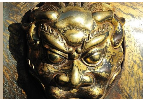
LEONES DE FU EN BEIJING