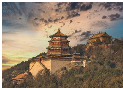
VISTA DE EL PALACIO DE VERANO

También conocido en chino como "Yiheyuan", es una joya arquitectónica y uno de los destinos culturales más impresionantes del país. Ubicado en las afueras de Beijing, este magnífico complejo está rodeado por un exuberante paisaje de jardines, lagos y colinas. Fue construido originalmente en el siglo XII durante la dinastía Jin y ha sido renovado y ampliado por varios emperadores a lo largo de los siglos.