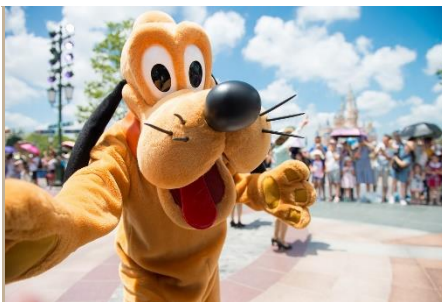
EL PARQUE DE DISNEYLAND DE SHANGHAI