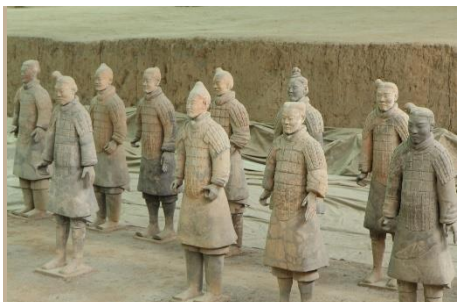
GUERREROS DE TERRACOTA DE XI'AN