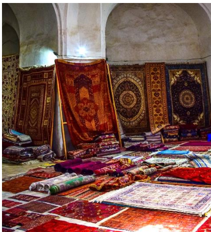
ALFOMBRAS DE SEDA EN EL MERCADO DE BUKHARA

El mar de Aral, que antiguamente era el tercer lago más grande del mundo, comenzó a disminuir en la década de los '60, después de que los ríos que lo alimentaban fueran desviados por proyectos de irrigación soviéticos. Hoy día, el mar ha desaparecido casi por completo, dejando en su lugar un desierto; la industria pesquera de la región, que alguna vez fue próspera, ha sido devastada. El resultado es una imagen curiosa de barcos pesqueros naufragados en medio del desierto.