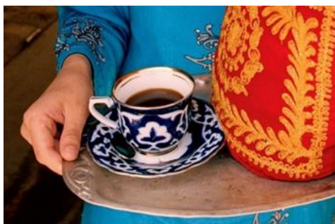
TÉ EN UNA CASA DE TÉ UZBEKA