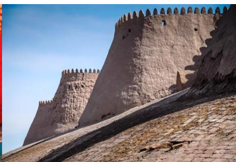
MURALLA DE KHIVA