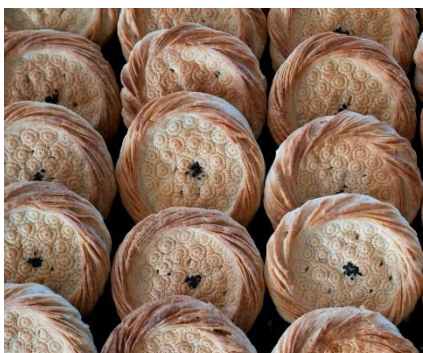
PAN UZBEKO TRADICIONAL, CON SU FORMA REDONDA CARACTERÍSTICA