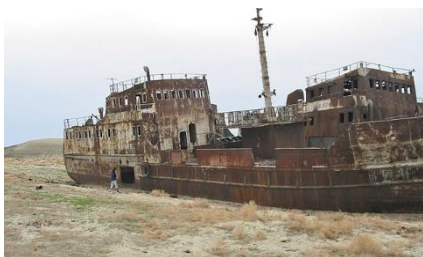
PAISAJE DESOLADOR: BARCOS EN EL DESIERTO DONDE ANTES HABÍA EL MAR ARAL