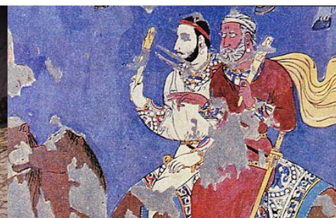
FRESCO EN AFRASIAB DEL AÑO 650