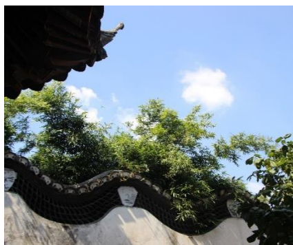
TEJADO ASILVESTRADO DEL JARDÍN YUYUAN

Está dividido en seis áreas principales, cada una con su propia belleza distintiva. El Salón de las Tres Delicias es el edificio principal del jardín y es conocido por su arquitectura clásica y su elegante diseño. Los pabellones, puentes y galerías que se encuentran en el jardín están adornados con intrincadas tallas de madera, piedras preciosas incrustadas y pinturas tradicionales chinas, que reflejan la maestría artística de la época.