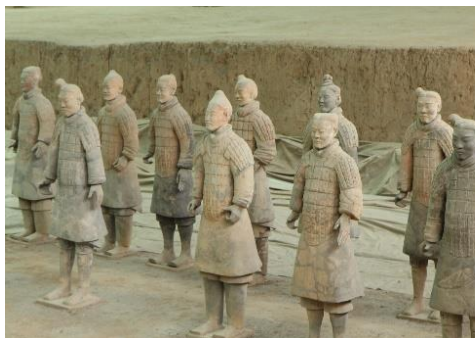
GUERREROS DE TERRACOTA DE XI'AN