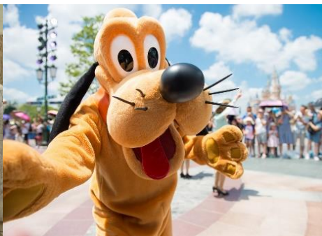
EL PARQUE DE DISNEYLAND DE SHANGHAI