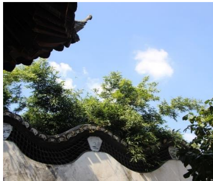
TEJADO ASILVESTRADO DEL JARDÍN YUYUAN