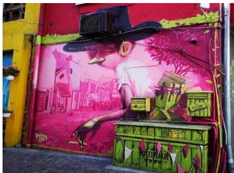
LOS MEJORES GRAFFITIS