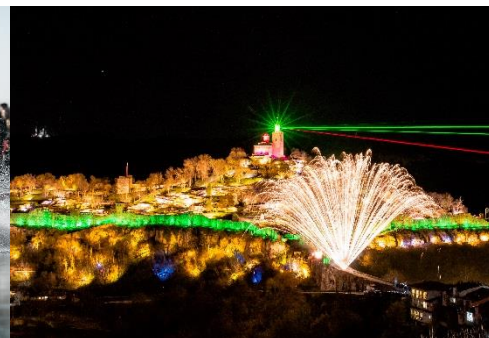
FORTALEZA EN VELIKO TARNOVO