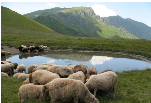
Fértiles pastos en Bulgaria