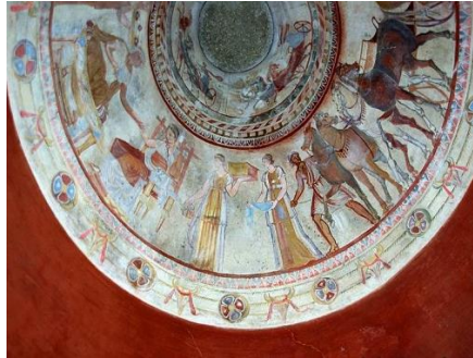
FRESCOS EN LA TUMBA TRACIA DE KAZANLAK

La tumba tracia más especial del país es original del siglo IV-III a.C., conocida como la Tumba de Kazanlak. Contiene impresionantes murales en el pasillo y la cámara abovedada: una de las obras mejor conservadas del antiguo arte mural de la época helenística temprana. El maestro, un pintor desconocido, trabajó con cuatro colores: negro, rojo, amarillo y blanco.