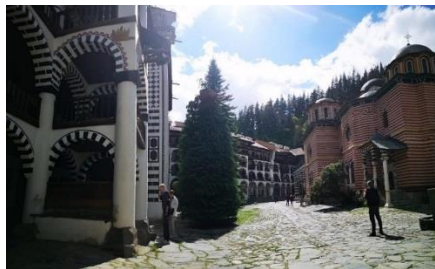
MONASTERIO DE RILA, a unos 120 km de Sofía

Situado en las profundidades de las montañas de Rila, a 1147 m. de altitud. Actualmente en funcionamiento, ofrece alojamiento y biblioteca a los visitantes. Se fundó en la primera mitad del siglo X. Su historia está directamente relacionada con el primer ermitaño búlgaro San Juan de Rila. En 1961 el monasterio fue declarado Museo Nacional de "Monasterio de Rila", en 1976 Reserva Nacional de Historia, y en 1983 la UNESCO incluyó el monasterio en la lista del Patrimonio de la Humanidad.