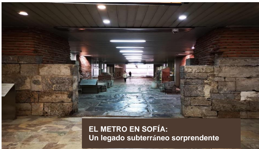
EL METRO EN SOFÍA: Un legado subterráneo sorprendente