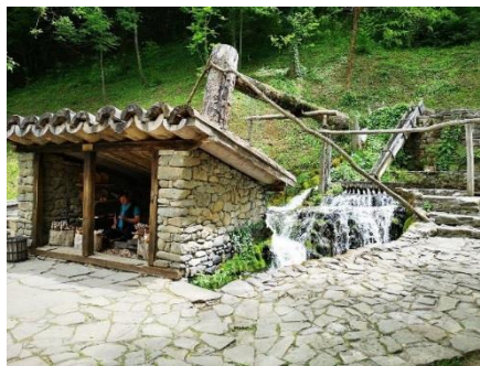
COMPLEJO ETNOGRÁFICO ETAR

En la calle de las artesanías, los visitantes pueden observar en tiempo real la labor de los maestros.