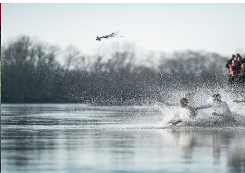
CELEBRANDO SAN JUAN