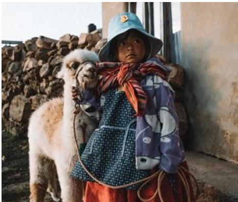
Local con una llama en la Isla del Sol