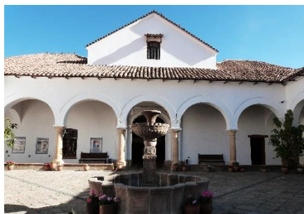
CASA DE LA LIBERTAD, Sucre

En 1825, Bolivia consiguió su independencia después de años de campañas independentistas contra los colonizadores españoles. Su independencia fue firmada en la ciudad de Sucre, en la Casa de la Libertad. En su fundación, Sucre llevaba el nombre de La Plata, debido a su cercanía a las minas de plata de Potosí, hasta que en 1839 fue rebautizada con su nombre actual en honor a su padre fundador, el Mariscal Antonio José de Sucre, que fue el primer Presidente de la República.