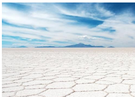
SALAR DE UYUNI

El Salar de Uyuni, situado a unos 3650 metros sobre el nivel del mar y con una superficie de 10.582 km 2 , es el desierto de sal más alto y más grande del mundo. Procedente de lagos prehistóricos evaporados, representa una fuente de economía gracias a la sal y al litio que se extrae. Durante las épocas más lluviosas, el agua de los lagos próximos se desboca y esta acumulación crea un efecto espejo del cielo y de las cimas más cercanas.