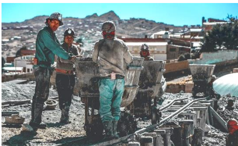
Trabajadores en las minas de plata