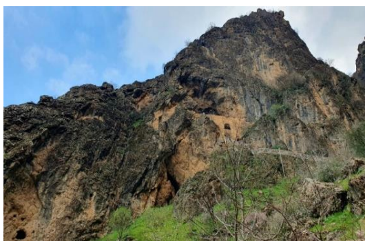
Monasterio kurdo Mar Matti (arr); alicatados (ab)