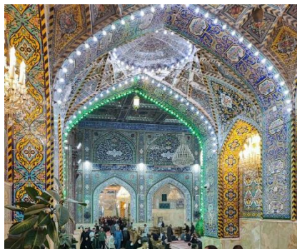
SANTUARIO DE KERBALA

En esas fechas millones de peregrinos chiitas visitan Kerbala durante 2-3 días. La población se solidariza con los peregrinos ofreciendo comida y bebida a lo largo del itinerario hacia Kerbala.