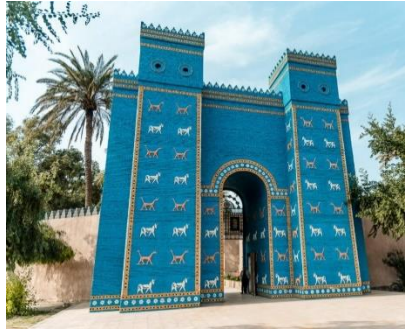
PUERTA DE ISHTAR (500 años antes de la era común)

La Puerta de Istarque podremos visitar en Babilonia es una copia que realizó Saddam Hussein. Los restos originales fueron objeto de contrabando por los arqueólogos que trabajaron a principios del siglo XX. Los jeques locales de Irak, bajo dominio otomanofacilitaron la expoliación de su patrimonio. Durante los últimos tiempos, Irak ha intentado sin éxito su repatriación, alegando los alemanes que la puerta está más segura en el Museo de Pérgamo de Berlín.