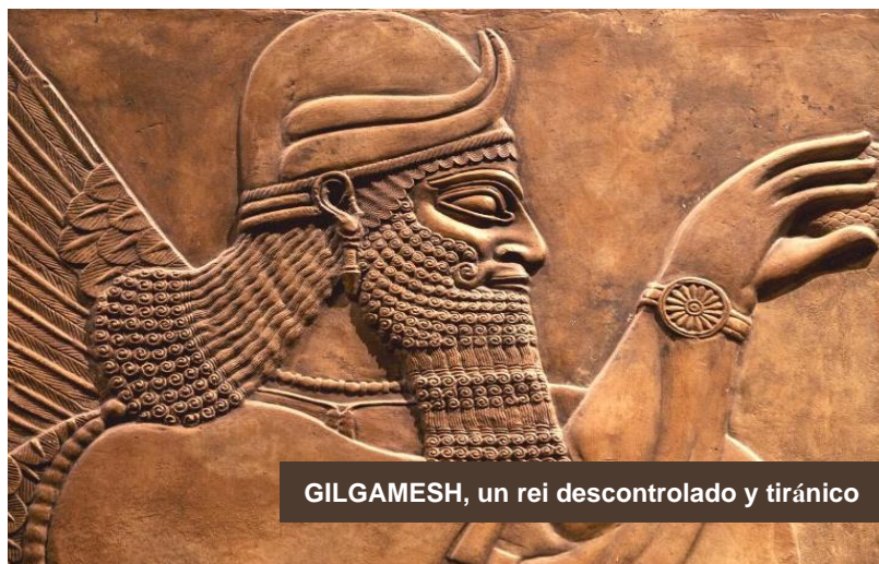
GILGAMESH, un rei descontrolado y tiránico