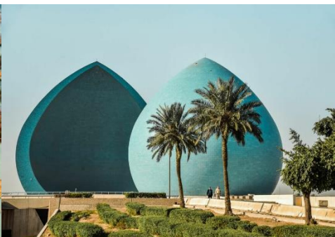
MONUMENTO A LOS MÁRTIRES EN BAGDAD