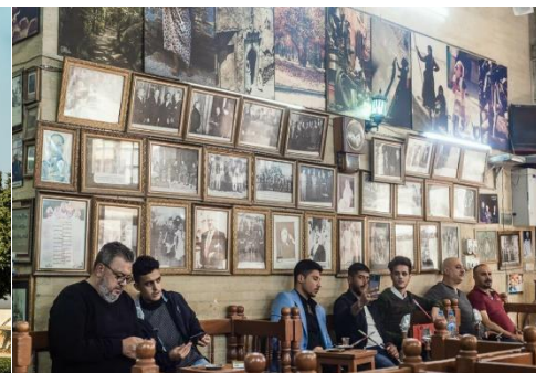
CAFÉ SHABANDAR, ANTIGUA TETERÍA EN BAGDAD