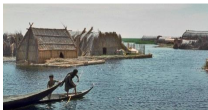
MARISMAS DE MESOPOTAMIA

Situadas entre el Tigris y el Eufrates, las marismas de Mesopotamia albergan una población autóctona, descendiente de los sumerios con un estilo propio de vida. Su cultura milenaria está basada en los recursos naturales de la zona y sus casas de caña "Mudhif" están construidas sin clavos, sin madera ni vidrio y se sostienen flotantes en el barro compactado de las isletas. Saddam Hussein ordenó en 1991 su drenaje y construyó una treintena de presas. Destruyó gravemente su ecosistema. Hoy está en proceso de recuperación.