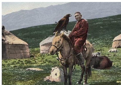
HOMBRE KAZAJO A CABALLO CON UN ÁGUILA, 1911

Los caballos son muy importantes en la cultura nómada de Kazajstán. Caballos existen en esta región desde el siglo V a.C., una raza particular de caballos de pasos cortos y trote brusco pero muy resistentes y capaces de cubrir largas distancias. La raza todavía es criada por tribus kazajas nómadas, principalmente para montar, aunque también se crían para carne.