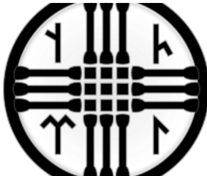
REPRESENTACIÓN RÚNICA DEL DIOS TENGRÍ, LA ESTRUCTURA DEL UNIVERSO, LA ABERTURA DEL TECHO DE UNA YURTA Y UN TAMBOR

El tengrismo es una religión basada en el chamanismo y animismo. Involucra al dios Tengri, una personificación del universo, y otras deidades. Fue la religión predominante de los pueblos göktürks, xianbei, búlgaros, mongoles y hunos. Las deidades pueden estar relacionadas con aspectos naturales del mundo, como el agua, el fuego, las estrellas, los relámpagos... Los animales son símbolos totémicos de dioses (las ovejas asociadas con el fuego, las vacas con el agua, los caballos con el viento y los camellos con la tierra). Los seguidores consideran que el propósito de la vida es estar en armonía con el universo.