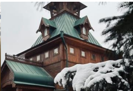
EL MUSEO DE INSTRUMENTOS