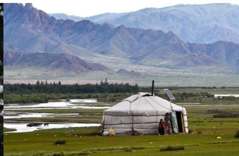
FAMILIA CON SU YURTA