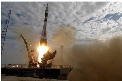
COSMÓDROMO DE BAIKONUR