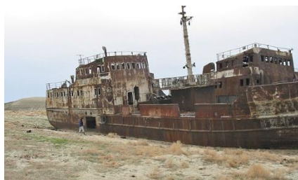
BARCO EN EL MAR DE ARAL