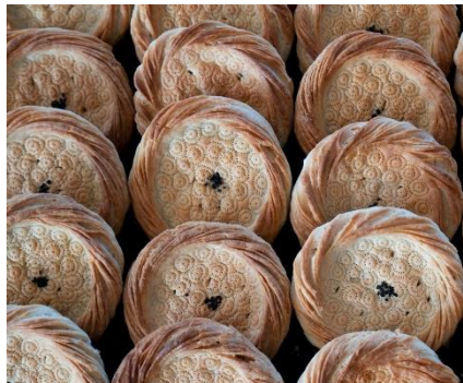
PAN UZBEKO TRADICIONAL, CON SU FORMA REDONDA CARACTERÍSTICA