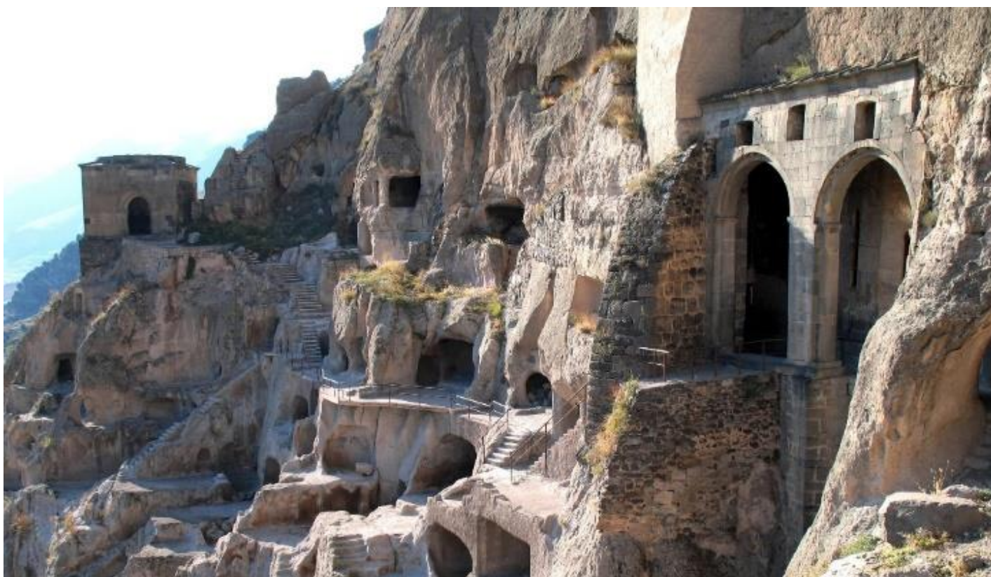
Alojamiento en Kutaisi.