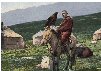
HOMBRE KAZAJO A CABALLO CON UN ÁGUILA, 1911

Los caballos son muy importantes en la cultura nómada de Kazajistán. Caballos existen en esta región desde el siglo V a.C., una raza particular de caballos de pasos cortos y trote brusco pero muy resistentes y capaces de cubrir largas distancias. La raza todavía es criada por tribus kazajas nómadas, principalmente para montar, aunque también se crían para carne.