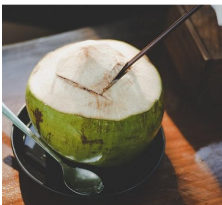
BEBIENDO LECHE DE COCO