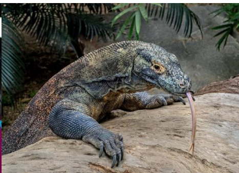
DRAGÓN DE KOMODO