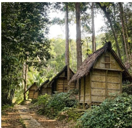
CABAÑAS EN BANTEN, INDONESIA

Indonesia produce 18,5 millones de toneladas de coco al año, lo que la hace la mayor productora del mundo. El coco impregna la mitología y las tradiciones indonesias. El árbol, a menudo llamado "el árbol de la vida", simboliza la fertilidad, la reposición y la conexión con lo divino. En algunas culturas de Indonesia, el coco es parte fundamental de numerosos rituales, ofrendas ceremoniales y rituales de purificación, donde se cree que transfiere energía sagrada, llamada "Taksu", de los dioses a los humanos.