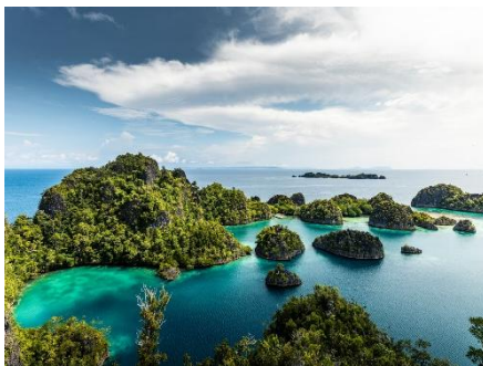
CONTAR LAS ISLAS DE INDONESIA NO ES TAREA FÁCIL – Y SOBRETUDO NO ES TAREA RÁPIDA