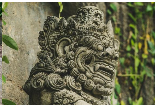
DETALLE EN TALLADO DE PIEDRA