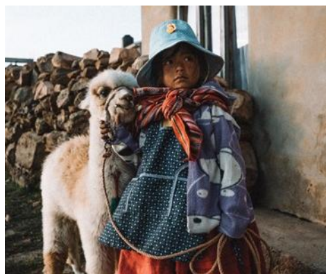
Local con una llama en la Isla del Sol