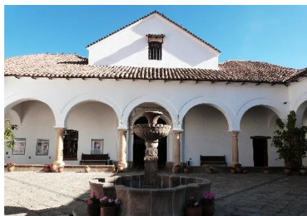
CASA DE LA LIBERTAD, Sucre

En 1825, Bolivia consiguió su independencia después de años de campañas independentistas contra los colonizadores españoles. Su independencia fue firmada en la ciudad de Sucre, en la Casa de la Libertad. En su fundación, Sucre llevaba el nombre de La Plata, debido a su cercanía a las minas de plata de Potosí, hasta que en 1839 fue rebautizada con su nombre actual en honor a su padre fundador, el Mariscal Antonio José de Sucre, que fue el primer Presidente de la República.