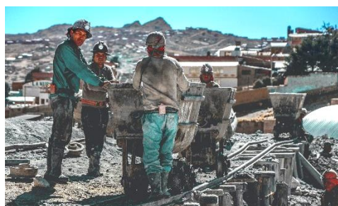
Trabajadores en las minas de plata