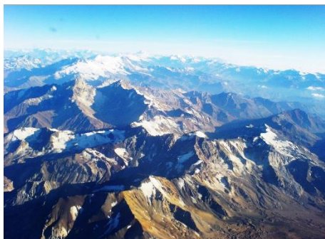
CORDILLERA DE LOS ANDES