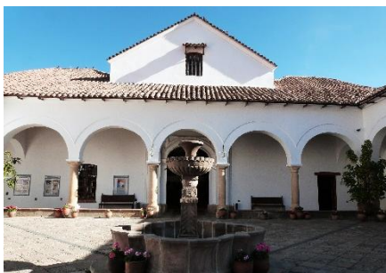
CASA DE LA LIBERTAD, Sucre

En 1825, Bolivia consiguió su independencia después de años de campañas independentistas contra los colonizadores españoles. Su independencia fue firmada en la ciudad de Sucre, en la Casa de la Libertad. En su fundación, Sucre llevaba el nombre de La Plata, debido a su cercanía a las minas de plata de Potosí, hasta que en 1839 fue rebautizada con su nombre actual en honor a su padre fundador, el Mariscal Antonio José de Sucre, que fue el primer Presidente de la República.