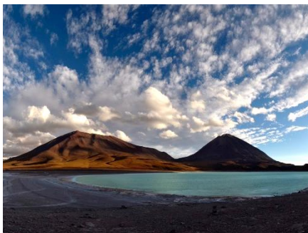
LAGO VERDE, Reserva Eduardo Abaroa

Por su extensión, Bolivia cuenta con una gran pluralidad de espacios naturales. Desde zonas erosionadas con grandes gamas de colores rojos, flamencos y muchos cactus, pasando por el desierto de sal de Uyuni, que crea un espejo de agua sobre un yacimiento tan blanco que destella, hasta zonas volcánicas de color oscuro y aguas turquesas.