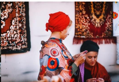
MUJER GEORGIANA COSIENDO