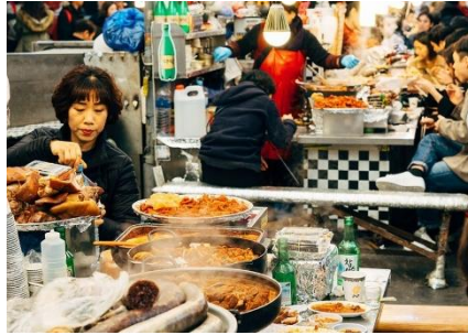
COMIDA CALLEJERA Y MERCADOS

No podemos obviar que desde el año 1945 la península de Corea vive partida en dos mitades por una línea de 258km de largo, la zona desmilitarizada. La brecha se agranda cuando vemos que Corea del Sur es un país extremadamente capitalista y el régimen autoritario de Corea del Norte es una dictadura socialista. Se trata de un conflicto de gran importancia social que tiene presencia en el día a día mundial y en la población coreana.