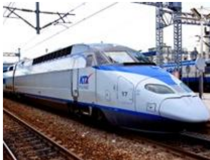
TREN COREANO KTX