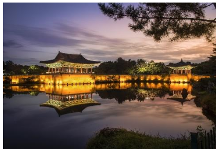
TRADICIÓN EN GYEONGJU

Uno de los encantos de Corea del Sur es la mezcla entre tradición y modernidad, una mezcla que ha ido adoptando una estética propia y diferenciada de sus países vecinos.