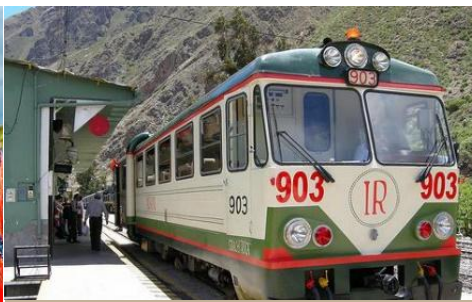
TREN HACIA AGUAS CALIENTES