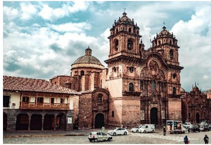
CATEDRAL BARROCA PRESIDIENDO LA PLAZA DE ARMAS DE CUSCO

El Imperio inca no solo dominó gran parte de los Andes, también supo leer la montaña como pocos pueblos en el mundo: construyó ciudades, terrazas agrícolas y caminos a más de 3.000 metros de altura, conectando valles lejanos mediante una red de senderos que hoy todavía se recorre en forma de trekking. Su organización se apoyaba en una idea clave, el ayni , una forma de cooperación comunitaria donde cada persona trabajaba para el bien del grupo, algo que aún se percibe en muchas comunidades andinas cuando se juntan para sembrar, cosechar o celebrar sus festividades. En los templos, plazas y huacas (lugares sagrados en quechua) se rendía culto al Sol, a la Luna y a las montañas, vistas como seres vivos que protegían a las personas, una cosmovisión que sigue dando sentido a muchos rituales actuales en Perú.