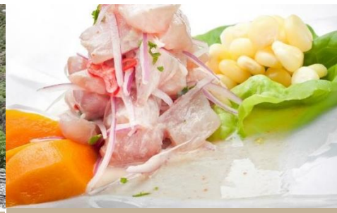
CEVICHE, PLATO TÍPICO