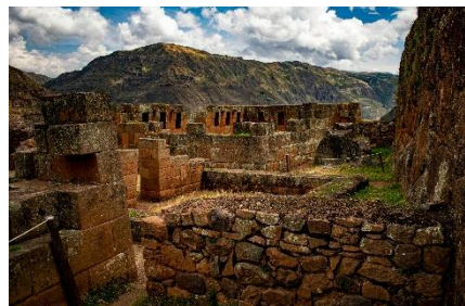
RESTOS DE ARQUITECTURA DE PIEDRA EN PISAC EN LAS MONTAÑAS ANDINAS