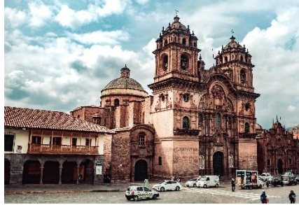
CATEDRAL BARROCA PRESIDIENDO LA PLAZA DE ARMAS DE CUSCO

El Imperio inca no solo dominó gran parte de los Andes, también supo leer la montaña como pocos pueblos en el mundo: construyó ciudades, terrazas agrícolas y caminos a más de 3.000 metros de altura, conectando valles lejanos mediante una red de senderos que hoy todavía se recorre en forma de trekking. Su organización se apoyaba en una idea clave, el ayni , una forma de cooperación comunitaria donde cada persona trabajaba para el bien del grupo, algo que aún se percibe en muchas comunidades andinas cuando se juntan para sembrar, cosechar o celebrar sus festividades. En los templos, plazas y huacas (lugares sagrados en quechua) se rendía culto al Sol, a la Luna y a las montañas, vistas como seres vivos que protegían a las personas, una cosmovisión que sigue dando sentido a muchos rituales actuales en Perú.