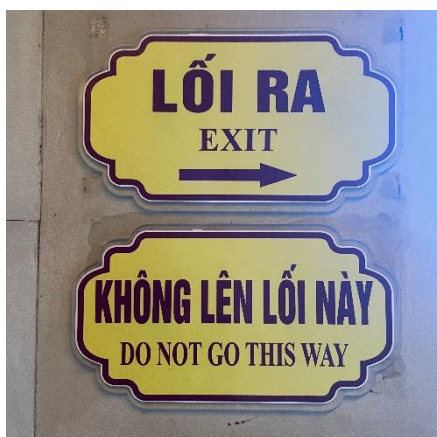
SEÑALES EN VIETNAMITA Y EN INGLÉS

El vietnamita, idioma de Vietnam, se escribe basándose en la escritura latina adoptada durante el dominio francés del siglo XX, con algunas vocales adicionales y marcas tonales. Y es que, en ser un idioma tonal, las mismas consonantes y vocales pueden significar cosas totalmente distintas según el tono. Por ejemplo má (madre), mả (tumba) o mã (caballo)... Esto sin tener en cuenta variaciones regionales. El idioma tiene varias otras curiosidades, como la gran cantidad de pronombres según la edad, el estatus social, la relación y la formalidad de la persona, o la falta de conjugación verbal (ni plurales ni tiempos verbales); se usa en vez partículas.