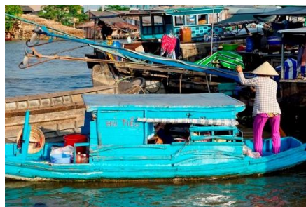
CASA FLOTANTE EN EL RÍO MEKONG

Desde su nacimiento en la meseta tibetana, el río Mekong atraviesa el suroeste de China, Myanmar, Laos, Tailandia, Camboya y el sur de Vietnam. Las variaciones estacionales del caudal y la presencia de rápidos y cascadas dificultan la navegación, aunque el río sigue siendo una importante ruta comercial. Dice una leyenda que en el siglo XIX una banda de ladrones se unía a las caóticas barcas de un mercado flotante en el delta del Mekong al anochecer. Aprovechaban el laberinto de vías fluviales para robar y desaparecer en los canales, sin ser descubiertos jamás. Cuentan que en rincones ocultos del delta aún se guardan secretos y tesoros perdidos de aquellos tiempos. Sea o no verdad, los vibrantes mercados y la vida en el río sigue activa.