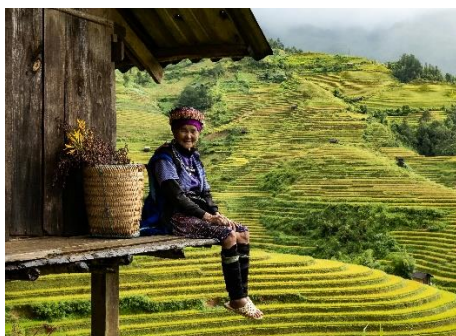
MUJER EN LOS CAMPOS DE ARROZ