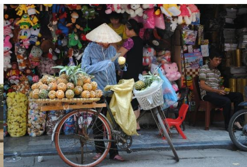
PELANDO PIÑAS EN EL MERCADO