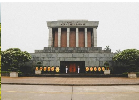
MAUSOLEO DE HO CHI MINH