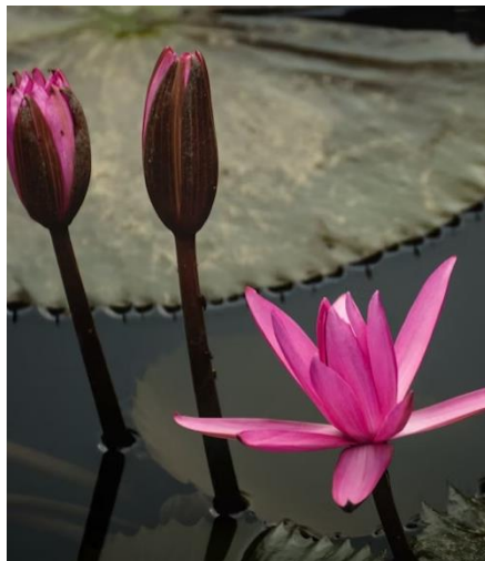
FLOR DE LOTUS EN UN TEMPLO

El loto desempeña un papel fundamental en la vida cotidiana vietnamita, apareciendo en ceremonias religiosas, festivales y celebraciones, como podría ser el cumpleaños de Buda. En la cultura budista esta flor simboliza la iluminación y el despertar espiritual, así se pueden ver a menudo en los templos. El loto tiene una capacidad de florecer del fondo fangoso de los estanques, algo que refleja la filosofía vietnamita de mantener la pureza y la dignidad en circunstancias difíciles.