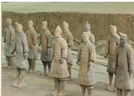
GUERREROS DE TERRACOTA DE XI'AN