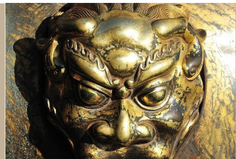
LEONES DE FU EN BEIJING