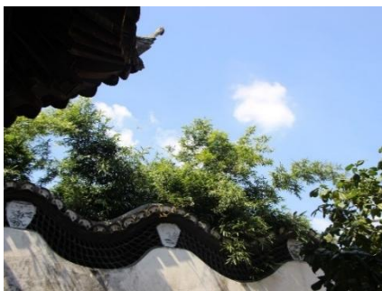
ARRIBA, TEJADO ASILVESTRADO DE YUYUAN; ABAJO, PUERTA CIRCULAR COMÚN EN JARDINES CHINOS