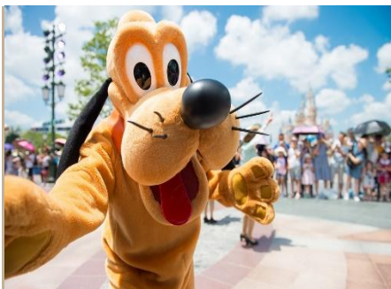
EL PARQUE DE DISNEYLAND DE SHANGÁI