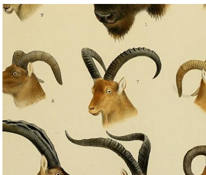
CAPRA CAUCASICA, TUR DEL CAUCASO OCCIDENTAL