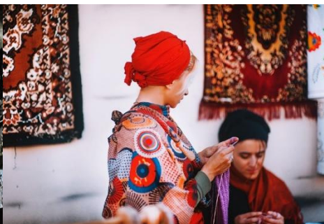
MUJER GEORGIANA COSIENDO