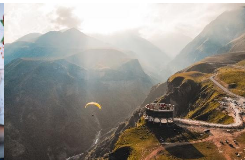
LAS MONTAÑAS GEORGIANAS