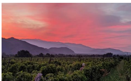
VIÑEDO EN SHAKRIANI, AL ESTE DE GEORGIA