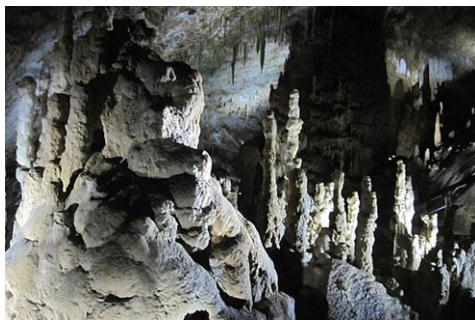
GRUTA DE PROMETEO