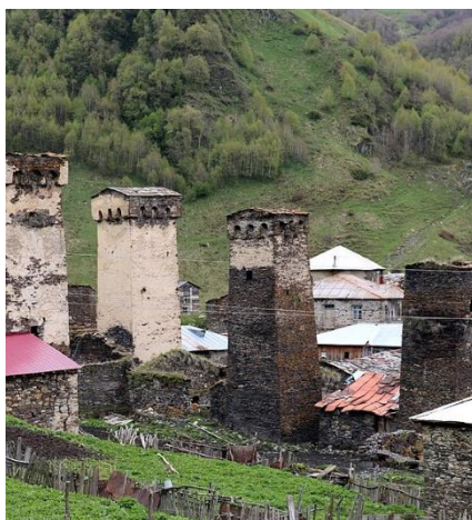
TORRES SVANESAS DE USHGULI

Se dice que el vino nació en Georgia. Las raíces de la viticultura georgiana se remontan al año 6000 a. C., cuando los habitantes del Cáucaso Sur descubrieron que el jugo de uva silvestre se convertía en vino al dejarlo enterrado durante el invierno en un pozo poco profundo. Una vez llenos con el jugo fermentado de la cosecha, los recipientes ( kvevris ) se cubren con una tapa de madera y luego se sellan con tierra. Algunos pueden permanecer enterrados hasta 50 años. Debido a su microclima diverso y único, existen alrededor de 500 variedades de uva en la Georgia moderna.