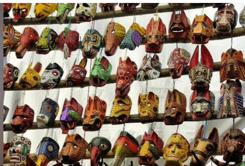
MÁSCARAS TRADICIONALES DE MADERA EN UN MERCADO