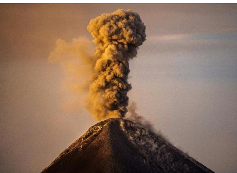
ERUPCIÓN DE UN VOLCÁN ACTIVO EN GUATEMALA