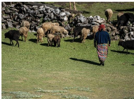
TRABAJO EN EL ALTIPLANO