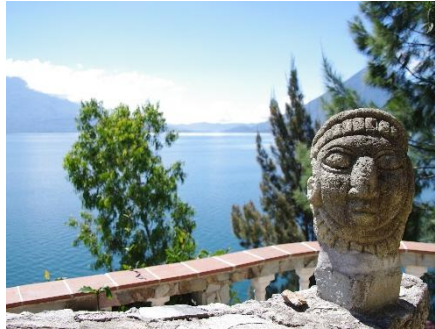
ESCULTURA MAYA FRENTE AL LAGO ATITLÁN

En Guatemala la cultura maya convive con escenarios naturales espectaculares: volcanes activos que rozan el cielo, el lago Atitlán rodeado de pueblos indígenas y la ciudad colonial de Antigua con sus iglesias barrocas y patios floridos. Aquí la tradición forma parte de la vida diaria, desde los tejidos artesanales hasta los mercados llenos de color donde todavía se siente el ritmo de las antiguas ceremonias.