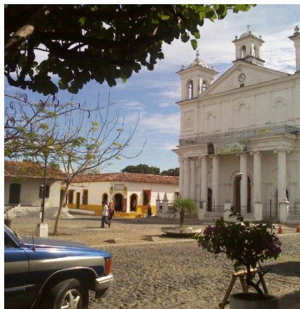
PLAZA CENTRAL DE SUCHITOTO

El Salvador, el país más pequeño del triángulo maya, sorprende con una cadena de volcanes, lagos de cráter y pueblos coloniales como Suchitoto. Entre mercados locales, artesanía colorida y playas del Pacífico, se descubre un país joven y dinámico en el que la población mantiene vivas sus raíces indígenas y campesinas.