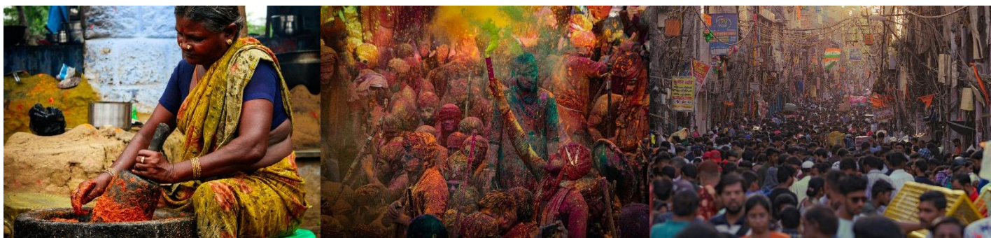
MUJER INDIA MOLRIENDO ESPECIAS DE FORMA TRADICIONAL