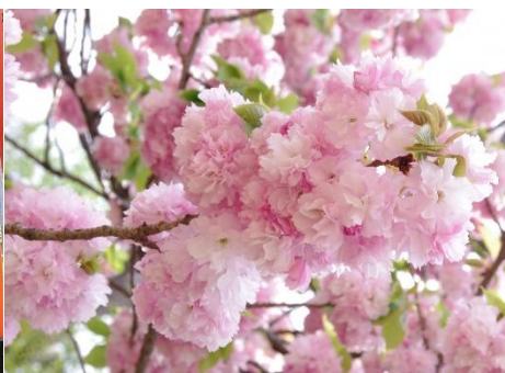
FLORES DE CEREZO ROSA EN PRIMER PLANO