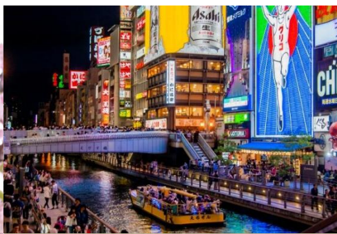
CANAL NOCTURNO EN OSAKA CON BARCA TURÍSTICA