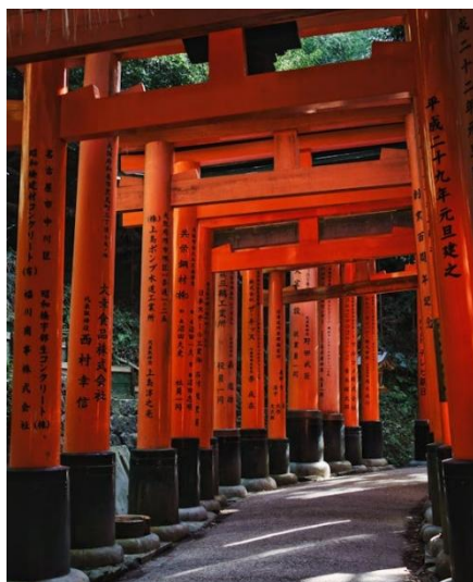
PUERTAS A LA ENTRADA DEL SANTUARIO FUSHIMI INARI (SINTOÍSTA) EN KYOTO