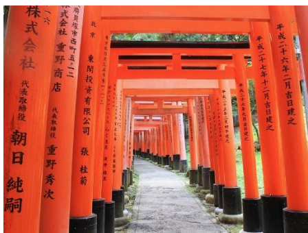
SANTUARIO FUSHIMI INARI, KIOTO