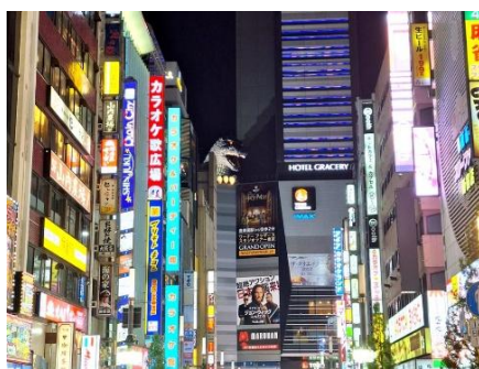
GOZILLA SE ASOMA SOBRE UN EDIFICIO EN SHINJUKU (ARRIBA); ABAJO, MURAL EN HARAJUKU

VACUNAS: No se exige ningún tipo de vacuna obligatoria para viajar a Japón. DOCUMENTACIÓN PARA ESPAÑOLES: Pasaporte en vigor (mínimo 6 meses). VISADO: De momento no se requiere para viajeros con pasaporte español. Consultar información actualizada en el momento de solicitud del viaje.