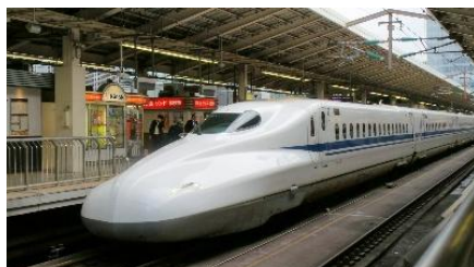
SHINKANSEN EN LA ESTACIÓN

Muchos desplazamientos en Japón se realizan con Shinkansen, el tren bala japonés. Son modernos, cómodos y puntuales: el retraso promedio se mide en segundos, no en minutos, y un retraso de más de un minuto suele dar lugar a una disculpa formal. Esta precisión se debe a una programación rigurosa, vías dedicadas y una estrecha coordinación. Por ejemplo, cuando un shinkansen llega a la estación de Tokyo, los limpiadores ya esperan de pie en el andén con su uniforme rosa, preparados para la acción. Los trenes se limpian en las terminales en unos 7 minutos, y el tren ya puede salir con los siguientes pasajeros. Sin lugar a duda, ir en tren ya supone una experiencia para el visitante.