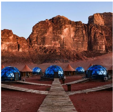
CAMPAMENTO EN EL DESIERTO DE WADI RUM CON CÚPULAS AZULES Y MONTAÑAS ROJAS AL FONDO.