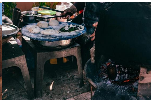
PREPARACIÓN DE PAN TRADICIONAL JORDANO EN UN HORNO DE LEÑA