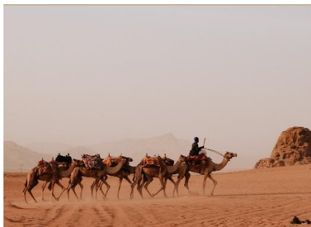
CARAVANA DE CAMELLOS ATRAVESANDO EL DESIERTO JORDANO