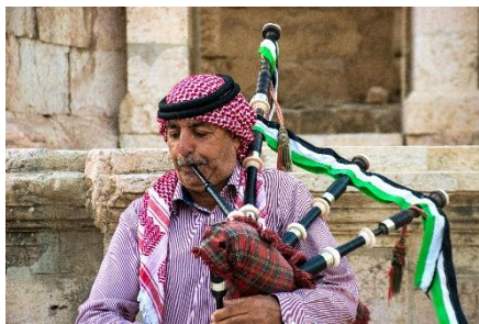
MÚSICO JORDANO CON KUFUYIA ROJA TOCANDO LA GAITA TRADICIONAL