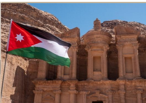
BANDERA DE JORDANIA ONDEANDO FRENTE A UNA FACHADA TALLADA EN LA ROCA DE PETRA