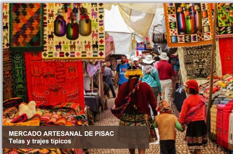
MERCADO ARTESANAL DE PISAC Telas y trajes típicos