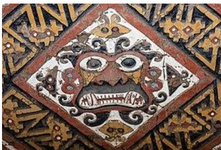
RELIEVE EN LA HUACA DE LA LUNA

Huaca es una palabra quechua que se utiliza para designar los lugares y objetos sagrados, así como los sepulcros de los indígenas de América del Sur, en especial de la zona Andina.