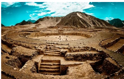
UNA VISTA DE CARAL PROPORCIONADA POR EL GOBIERNO DE PERÚ

Con sus 5000 años de antigüedad, constituye la manifestación más antigua no solo de la civilización en el Perú sino también en el continente americano. Expresa la complejidad y el desarrollo de un modelo de organización socio político y económico temprano durante el Periodo Arcaico Tardío (5000-3800 BP) originado de manera independiente por las sociedades andinas que habitaron este pequeño valle fértil de la costa central peruana. Es una de las joyas que visitaremos en este viaje tan especial.