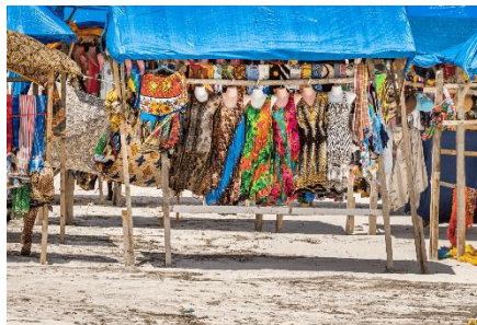
PUESTOS DE MERCADO EN LA PLAYA CON TELAS Y VESTIDOS DE COLORES COLGADOS BAJO TOLDOS AZULES

Kenia es un país donde las relaciones personales se cuidan: ningún encuentro empieza sin un saludo largo, preguntas por la familia y un apretón de manos que muestra respeto. La palabra suajili Harambee , que significa "todos tirando en la misma dirección", expresa el espíritu de ayuda mutua que une a las comunidades y es incluso el lema nacional del país. En reuniones familiares, partidos de fútbol o celebraciones religiosas, no falta el té con leche, el nyama choma (carne asada) y platos compartidos que convierten cada comida en un momento de encuentro.