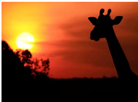
SAFARI AL ATARDECER EN EL MASAI MARA