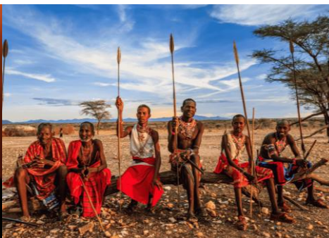
PERSONAS MASÁI SENTADAS EN LA SABANA KENIATA