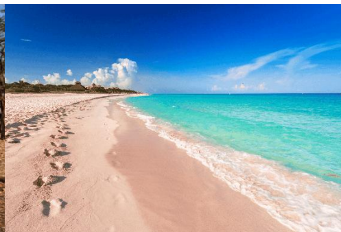
PLAYAS DEL ÍNDICO EN LA COSTA SUAJILI