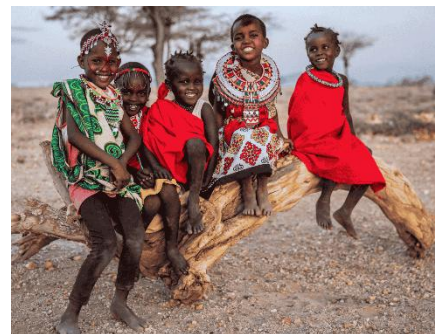
NIÑOS MASÁI SENTADOS SOBRE UN TRONCO EN LA SABANA KENIATA CON VESTIMENTA TRADICIONAL DE COLORES.

En Kenia conviven más de cuarenta grupos étnicos diferentes, cada uno con su lengua, su música y sus rituales, pero todos comparten una fuerte importancia de la familia y la comunidad. En las ciudades se escucha una mezcla de suajili, inglés y lenguas locales, y no es raro que los jóvenes cambien de idioma en la misma frase, reflejando una identidad abierta y dinámica. Los viajeros suelen recordar la sonrisa de la gente, la curiosidad con la que te preguntan por tu país y esa sensación de ser siempre bienvenido, tanto en una casa rural como en un café de Nairobi.