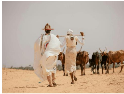
DOS PASTORES DE ESPALDAS CAMINANDO POR EL DESIERTO ACOMPAÑADOS DE SU REBAÑO DE VACAS.

En el Maasai Mara la sabana se mezcla con las manyattas, los poblados circulares donde viven las familias masái, construidos con barro, paja y estiércol para protegerse del calor y de los animales. Al amanecer, los pastores salen con el ganado mientras los niños aprenden desde pequeños a cuidar de las reses, auténtica riqueza de la comunidad. Compartir una visita respetuosa a una aldea permite conocer sus cantos, su artesanía de cuentas de colores y una forma de vida que sigue ligada al ritmo de las estaciones y a la tierra.