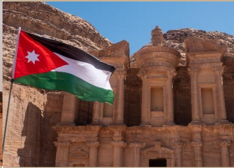
BANDERA FRENTE A PETRA