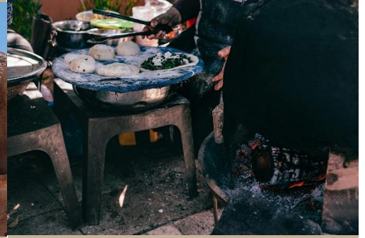
PREPARACIÓN DE PAN TRADICIONAL