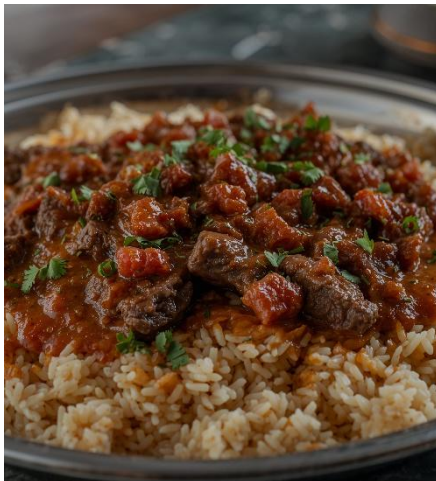
PLATO DE MANSAF JORDANO CON ARROZ Y CARNE

En el desierto de Wadi Rum, también llamado "el valle de la Luna" debido a su parecido a este cuerpo celestial, muchas familias beduinas siguen viviendo en campamentos de tiendas negras hechas de pelo de cabra. Allí reciben a los viajeros con té de menta, historias junto al fuego y paseos en camello o en 4x4 entre cañones de roca roja y dunas doradas. Dormir en el desierto, bajo un cielo lleno de estrellas, permite entender la estrecha relación que los beduinos mantienen con la naturaleza y con las rutas caravaneras que cruzaban esta zona desde hace siglos.