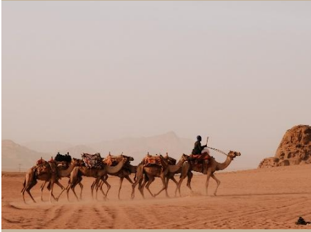
CAMELLOS EN EL DESIERTO