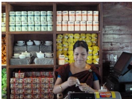
TIENDA DE TÉ EN NUWARA ELIYA