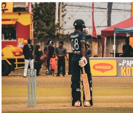
JUGADOR DE CRÍQUET

El críquet es un deporte popular en muchas de las antiguas colonias inglesas, Sri Lanka no es una excepción. En realidad, el Ministerio de Deportes designó al voleibol como el deporte nacional, pero el no ha conseguido la misma popularidad que el críquet. La selección nacional de críquet de Sri Lanka alcanzó un éxito considerable a partir de la década de 1990, pasando de ser un equipo poco favorito a ganar la Copa Mundial en 1996. Desde entonces, el equipo ha seguido siendo una potencia y, actualmente, puede presumir de varios récords mundiales.