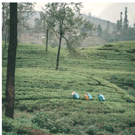
RECOLECTANDO EL TÉ EN UNA PLANTACIÓN

El té de Ceilán es tanto la marca de té que se produce en Sri Lanka como un término histórico que describe el té negro de esta tierra. El té de Ceilán es un pilar de la cultura, el patrimonio y la identidad de Sri Lanka. El país es el segundo mayor exportador de té del mundo, sus principales competidores siendo China y Kenia, este último cada vez va ganando más terreno.