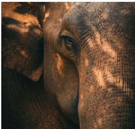
ELEFANTE EN UDAWALAWA

El elefante de Sri Lanka es originario de la isla; se estima que Sri Lanka tiene la mayor densidad de elefantes de toda Asia, con unos 7000 ejemplares en el país. Desde la antigüedad los elefantes eran venerados como símbolos de sabiduría y prosperidad, la gente creía que incluso verlos podía indicar buenos augurios en la vida. Desde tiempos inmemoriales, los antiguos reyes de Sri Lanka han domesticado elefantes para usarlos como elefantes de trabajo y de guerra, en desfiles culturales, y los animales se exportaron a otros reinos y naciones durante siglos. El conflicto entre humanos y elefantes está aumentando debido a la conversión de su hábitat en zonas de cultivo y asentamiento humano, así Sri Lanka también se ha convertido en el país con la mayor tasa de mortalidad de elefantes del mundo. Nuevas estrategias de conservación se están desarrollando, y se siguen usando elefantes domesticados en la tala de árboles y para turismo.