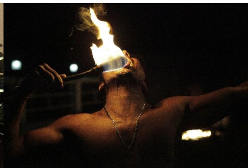
FESTIVAL DE KANDY