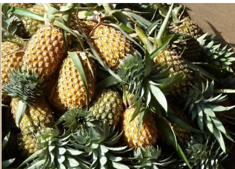
PIÑAS EN UN MERCADO