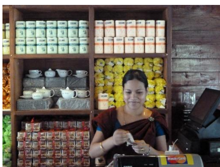
TIENDA DE TÉ EN NUWARA ELIYA