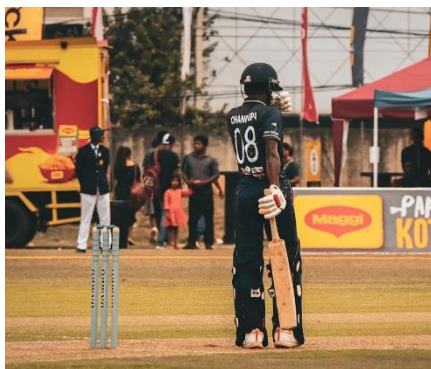
JUGADOR DE CRÍQUET

El críquet es un deporte popular en muchas de las antiguas colonias inglesas, Sri Lanka no es una excepción. En realidad, el Ministerio de Deportes designó al voleibol como el deporte nacional, pero el no ha conseguido la misma popularidad que el críquet. La selección nacional de críquet de Sri Lanka alcanzó un éxito considerable a partir de la década de 1990, pasando de ser un equipo poco favorito a ganar la Copa Mundial en 1996. Desde entonces, el equipo ha seguido siendo una potencia y, actualmente, puede presumir de varios récords mundiales.