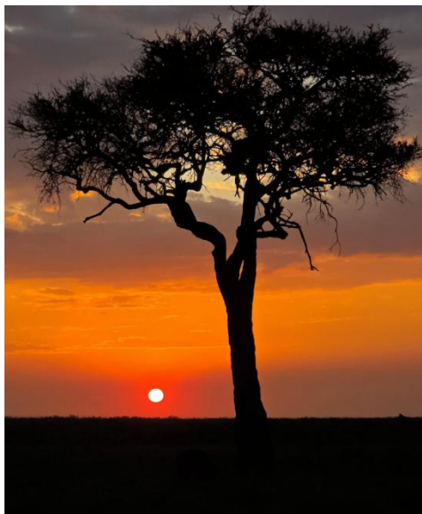
Atardecer en la sabana con acacia silueteada