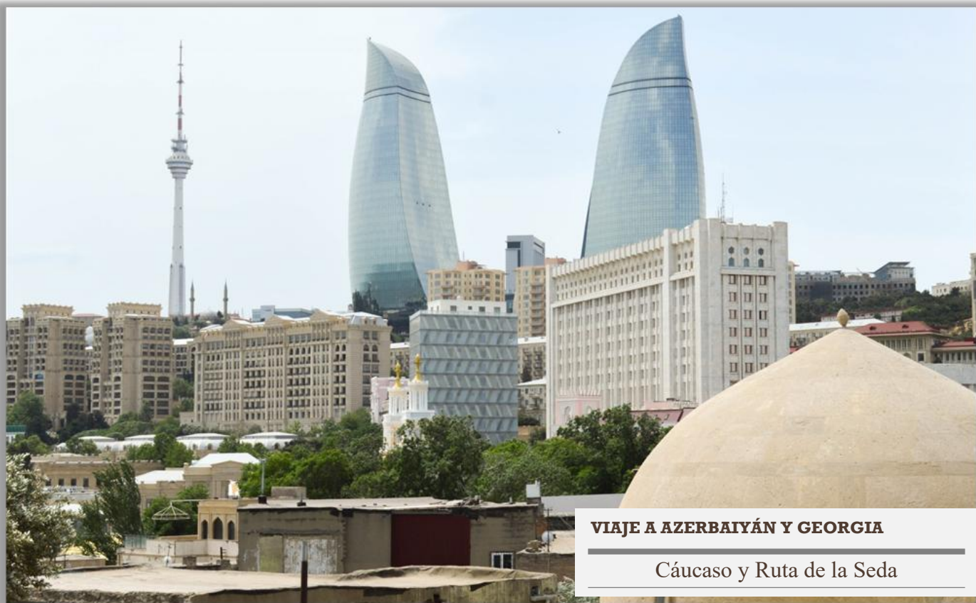
VIAJE A AZERBAIYÁN Y GEORGIA