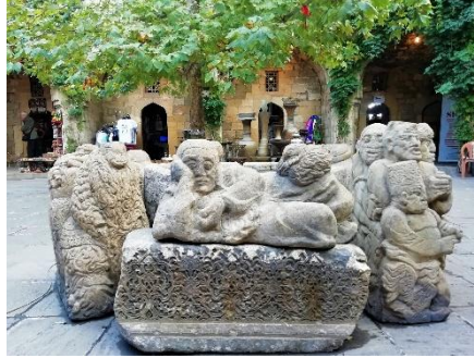
RESTOS DE UN CARAVANSAR EN BAKÚ

Azerbaiyán se abre entre el mar Caspio y las montañas del Gran Cáucaso, en pleno trazado de la antigua Ruta de la Seda. Mezquitas, palacios orientales y edificios rusos recuerdan a los siglos de influencias persas, turcas y soviéticas, hoy reunidas en ciudades como Bakú y en caravasares históricos como los de Sheki. La identidad azerí, de mayoría musulmana y carácter laico, se descubre en la música mugham, en la gastronomía y en la hospitalidad de la gente, siempre acompañada de té negro y dulces como la baklava.