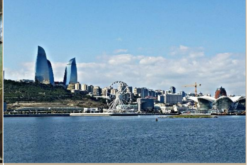
SKYLINE MODERNO DE BAKÚ FRENTE AL MAR CASPIO