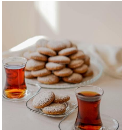
GALLETAS Y TÉ DE AZERBAIYÁN

Lejos del bullicio de la capital, la vida discurre al ritmo pausado del té negro servido en pequeños vasos en forma de pera, verdadero símbolo de hospitalidad azerí. En pueblos históricos como Sheki o Lahij, las casas de piedra y los talleres artesanales se llenan de alfombras tejidas a mano, cobre repujado y el aroma de pan recién hecho. Para el viajero, sentarse a compartir té, dulces y conversación con una familia local es una de las maneras más sencillas y auténticas de comprender el alma del país.