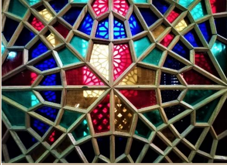
VENTANA TRADICIONAL DE SHEBEKE