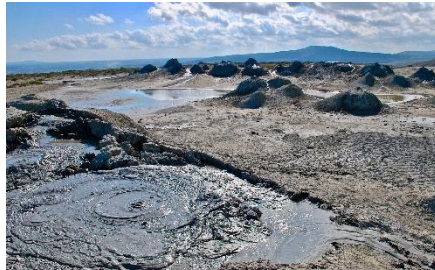
VOLCANES DE LODO DE GOBUSTÁN

En pocas horas de viaje desde Bakú, el paisaje se transforma en una meseta casi lunar donde el barro burbujea y el gas natural arde sin cesar. Los volcanes de lodo de Gobustán forman uno de los conjuntos más densos del mundo y ofrecen un escenario único, salpicado de cráteres y pequeñas erupciones frías que sorprenden a cualquier viajero. Muy cerca, en lugares como Yanar Dag o el templo de Ateshgah, las llamas que brotan del subsuelo recuerdan por qué a Azerbaiyán se le conoce desde antiguo como la 'Tierra del Fuego'.