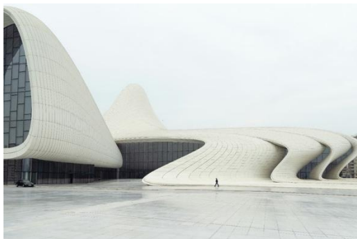
Centro Heydar Aliyev