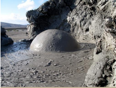
VOLCANES DE GOBUSTÁN