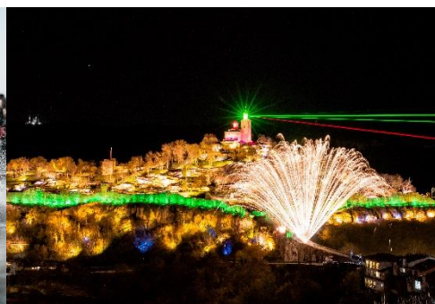
FORTALEZA EN VELIKO TARNOVO