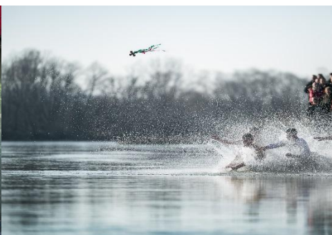
CELEBRANDO SAN JUAN