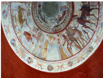
FRESCOS EN LA TUMBA TRACIA DE KAZANLAK

La tumba tracia más especial del país es original del siglo IV-III a.C., conocida como la Tumba de Kazanlak. Contiene impresionantes murales en el pasillo y la cámara abovedada: una de las obras mejor conservadas del antiguo arte mural de la época helenística temprana. El maestro, un pintor desconocido, trabajó con cuatro colores: negro, rojo, amarillo y blanco.