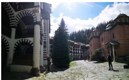
MONASTERIO DE RILA, a unos 120 km de Sofía

Situado en las profundidades de las montañas de Rila, a 1147 m. de altitud. Actualmente en funcionamiento, ofrece alojamiento y biblioteca a los visitantes. Se fundó en la primera mitad del siglo X. Su historia está directamente relacionada con el primer ermitaño búlgaro San Juan de Rila. En 1961 el monasterio fue declarado Museo Nacional de "Monasterio de Rila", en 1976 Reserva Nacional de Historia, y en 1983 la UNESCO incluyó el monasterio en la lista del Patrimonio de la Humanidad.