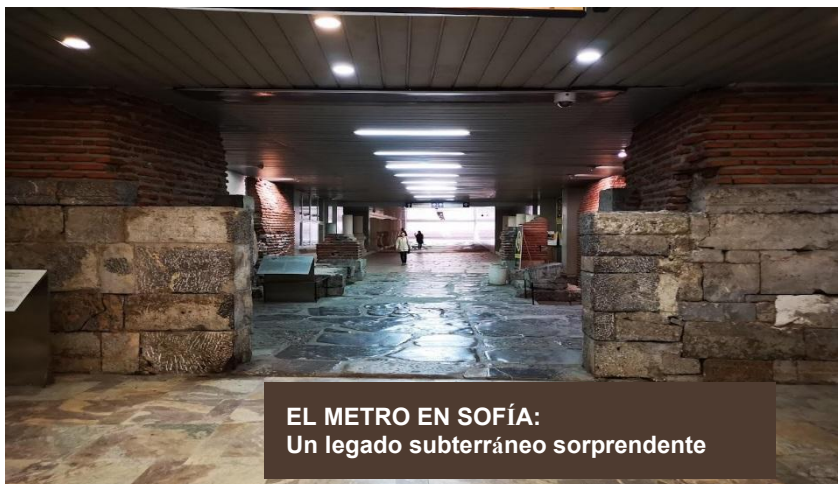
EL METRO EN SOFÍA: Un legado subterráneo sorprendente