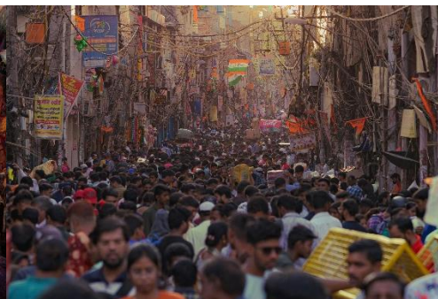
CALLE MUY CONCURRIDA EN UNA CIUDAD AL ATARDECER.