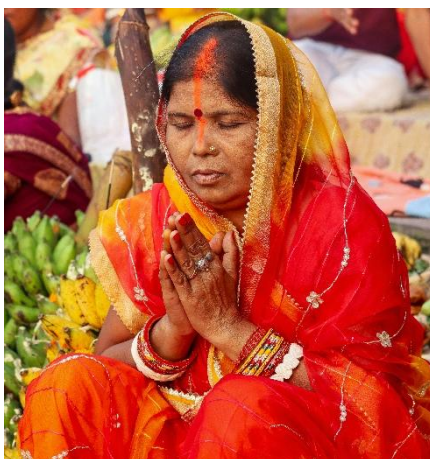
MUJER INDIA EN SARI NARANJA HACIENDO NAMASTÉ