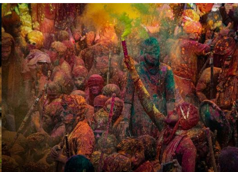
MULTITUD CELEBRANDO UN FESTIVAL DE COLORES EN LA INDIA.