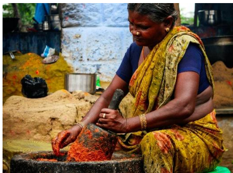
MUJER INDIA MOLRIENDO ESPECIAS DE FORMA TRADICIONAL