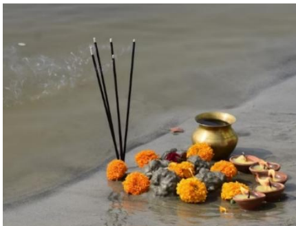
OFRENDA CON CALÉNDULA

La cocina india cambia por completo de una región a otra, pero en todas las mesas las especias son protagonistas: cardamomo, cúrcuma, comino, cilantro o garam masala dan personalidad a cada plato. En el norte se encuentran curris más cremosos, panes como el naan o el roti y platos tandoori cocinados en horno de barro, mientras que en el sur predominan los sabores del coco, el arroz y las dosas crujientes rellenas de verduras. Comer con la mano derecha, mezclando arroz, salsas y guarniciones, sigue siendo una costumbre muy extendida porque se considera una forma más íntima de conectar con la comida.