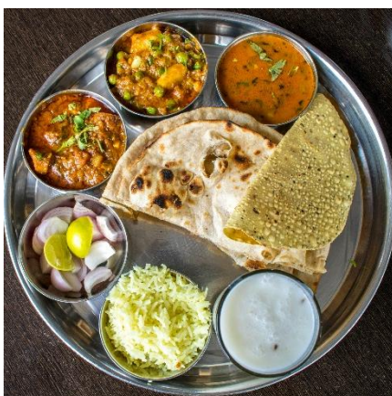
THALI, PLATO INDIO TRADICIONAL