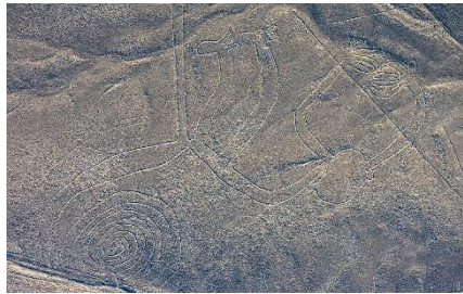
UNA VISTA DE LAS LÍNEAS DE NAZCA

Los geoglifos, muchos de ellos intactos son imágenes de naturaleza pero también representan personajes antropomorfos, multizoomorfos y sobrenaturales.