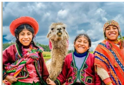
EN CUSCO CON VESTIDOS TRADICIONALES