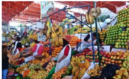
MERCADO DE FRUTA EN LIMA

La gastronomía peruana es una de las más ricas y diversas del mundo. A lo largo de los milenios, ha ido evolucionando por estar en contacto directo con otras culturas. Durante el viaje no podemos olvidarnos de probar algunos de sus platos más característicos.