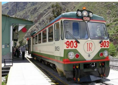
TREN HACIA AGUAS CALIENTES