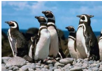
PINGÜINOS DE HUMBOLD

Las Islas Ballestas son unas islas que están en el Océano Pacífico, próximas a la costa del Perú. La abundante vida que existe en la bahía y las islas se hace posible gracias a las corrientes frías de Humboldt que llenan las aguas de las Islas Ballestas de plancton y microorganismos, enriqueciendo aún más este mar con cardúmenes de peces como lenguados, cojinovas, corvinas, toyos y anchovetas. El pingüino de Humboldt es la única especie de pingüino en el Perú. También miles de aves marinas vuelan entre las Islas Ballestas y pueden llegar a verse sus nidos sobre las rocas.