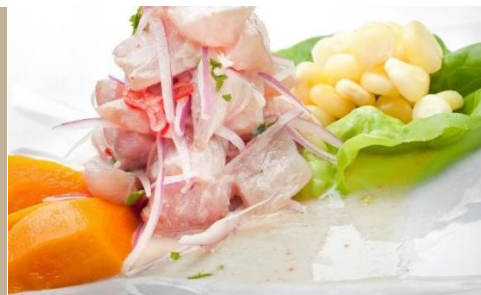
CEVICHE, PLATO TÍPICO