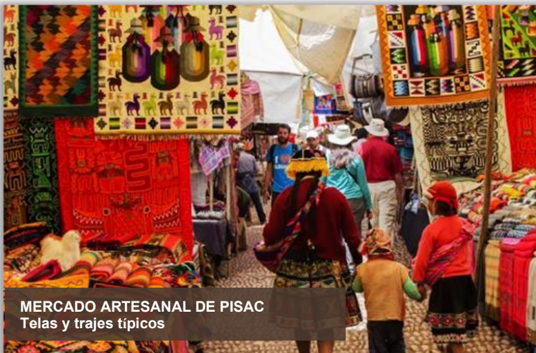
MERCADO ARTESANAL DE PISAC Telas y trajes típicos