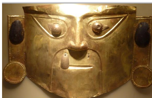
Máscara de oro (arr) y Ajuar funerario Chimú (ab.)