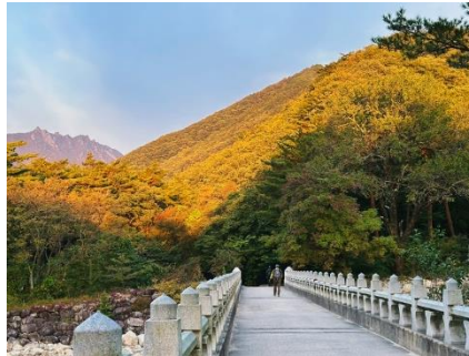
PARQUE NACIONAL SEORAKSAN

Es considerada una de las montañas más bellas de todo el país y es un destino muy popular tanto para los turistas locales como para los extranjeros. Con una altura de 1,708 metros y está ubicada dentro del Parque Nacional Seoraksan. El parque nacional es famoso por su paisaje escénico, con picos altos, valles profundos, ríos, cascadas y hermosos bosques. Seoraksan es especialmente famoso durante el otoño, cuando las hojas de los árboles cambian de color y crean un paisaje realmente impresionante.